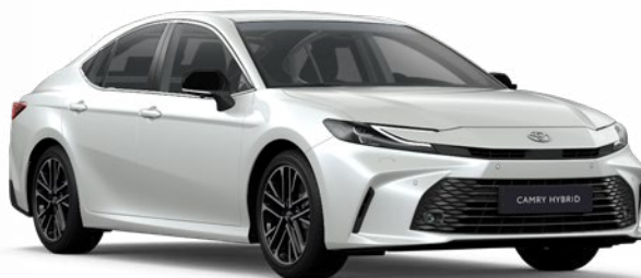
089 Platina gyöngyfehér Gyöngyház 390 000 Ft