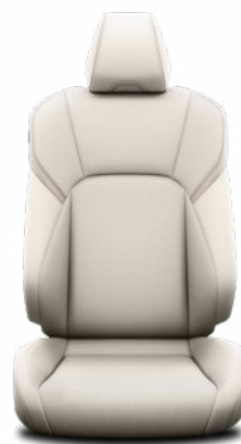
Törtfehér bőr ülésborítás Alapfelszereltség a Prestige és Executive felszereltségnél