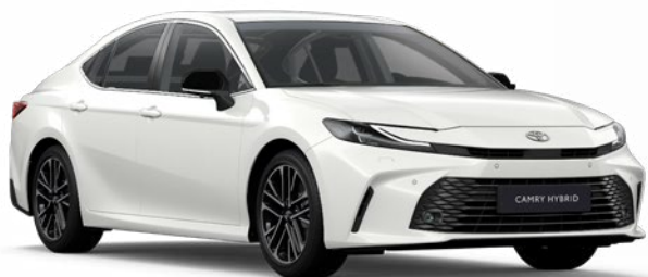
040 Hófehér Alapszín felár nélkül