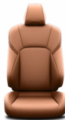
Barna bőr ülésborítás Alapfelszereltség a Prestige és Executive felszereltségnél