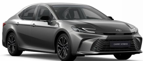
1L5 Sötétszürke metál Metál 390 000 Ft