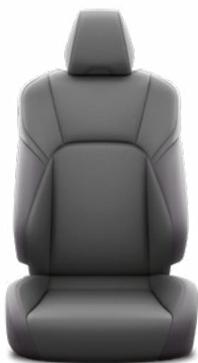
Fekete szövet ülésborítás Alapfelszereltség a Comfort modellváltozatnál