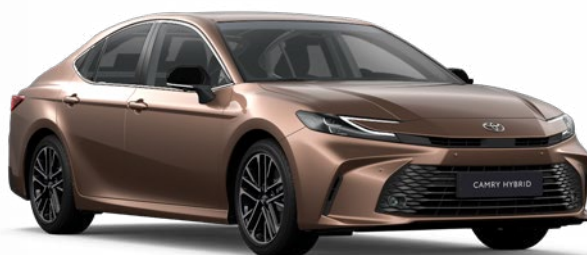
4Y6 Bronz Egyedi 390 000 Ft