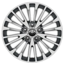
17" könnyűfém keréktárcsák 215/55 R17 gumiabroncsokkal Alapfelszereltség a Comfort modellváltozatnál