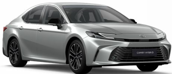
1F7 Ezüstmetál Metál 390 000 Ft