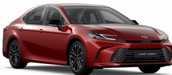
3U9 Érzéki vörös Egyedi 390 000 Ft