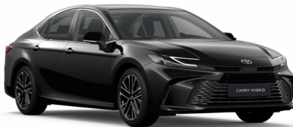
229 Klasszikus fekete Metál 280 000 Ft