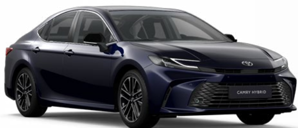
8X8 Sötétkék mica Metál 280 000 Ft