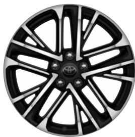
18" csiszolt hatású könnyűfém keréktárcsák 235/45 R18 méretű gumiabroncsokkal Alapfelszereltség a Prestige és az Executive modellváltozatoknál