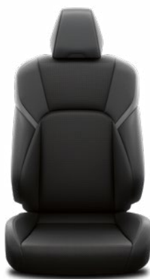
Fekete bőr ülésborítás Alapfelszereltség a Prestige és Executive felszereltségnél