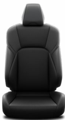
Fekete szintetikus bőr ülésborítás szövet betétekkel Alapfelszereltség a Comfort Business modellváltozatban