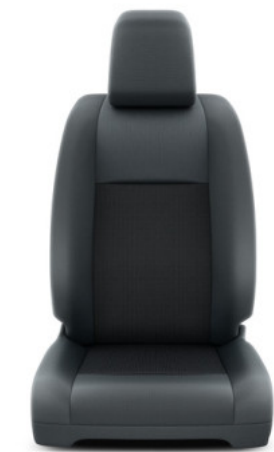
Fekete szövet ülésborítás Alapfelszereltség Combi és Business modelleken