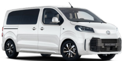
EPR Hófehér felár nélkül