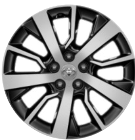
17" könnyűfém keréktárcsák