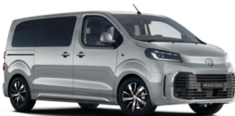
KCA Ezüst Metálfényezés Bruttó 280 000 Ft