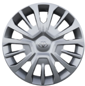
16"/17" acél keréktárcsák dísz tárcsával