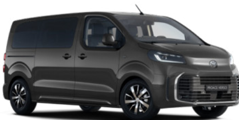
KKJ Titánszürke Metálfényezés Bruttó 280 000 Ft