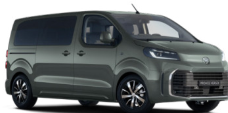
EDU Terepzöld Metálfényezés Bruttó 280 000 Ft