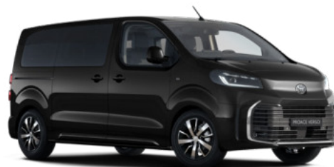
KTV Éjfekete Metálfényezés Bruttó 280 000 Ft