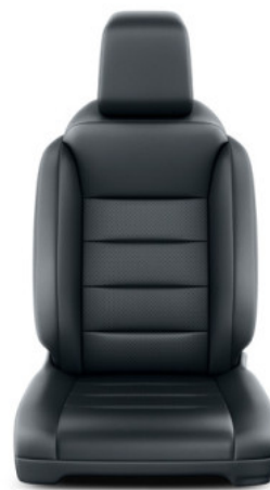
Fekete bőr Alapfelszereltség VIP modelleken