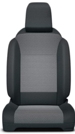
Fekete szövet barna betétekkel Alapfelszereltség Family modelleken