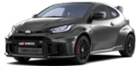
1L5 Nikkelezüst* 270 000 Ft