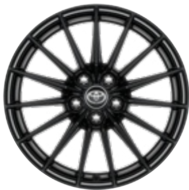
18" könnyűfém keréktárcsák 225/40 R18

Alapfelszereltség a Dynamic és Aero Performance felszereltségi szinteken