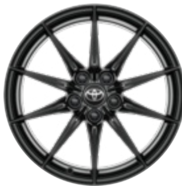
18" kovácsolt könnyűfémfelni 225/40 R18

Alapfelszereltség a Dynamic és Aero Performance felszereltségi szinteken