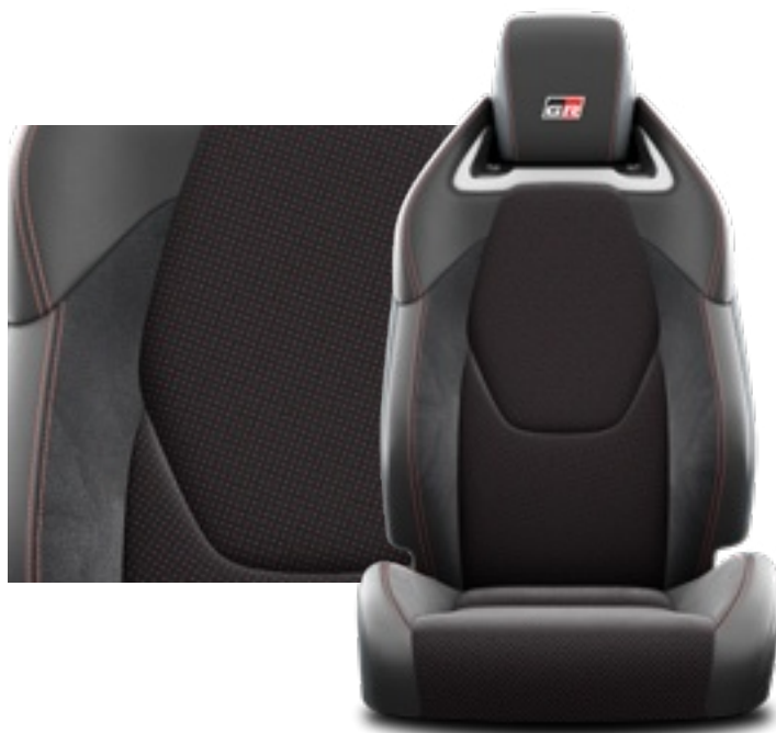
Fekete EKO velúr Ultrasuede™ és szintetikus bőr ülésborítás vörös díszítéssel Alapfelszereltség a Dynamic és Aero Performance felszereltségi szinteken