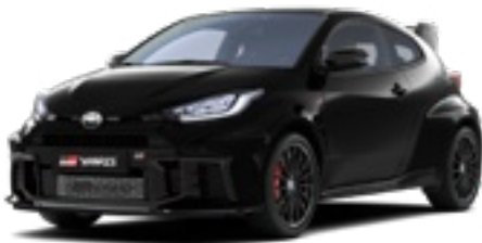
219 Éjfékete* 270 000 Ft