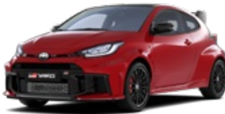
3U5 Érzéki vörös* 270 000 Ft