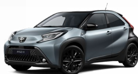
2UP Szürkéskék fekete tetővel Felár nélkül Elérhető a Style Design felszereltségnél