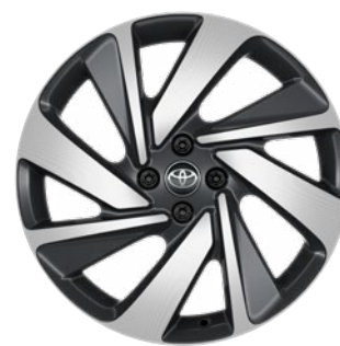
18" könnyűfém keréktárcsák, 175/60 R18 gumiabroncs Alapfelszereltség: Executive