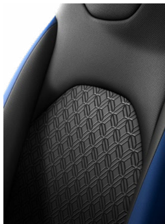
Fekete szövet ülésborítás, oldala a karosszéria színében Alapfelszereltség: Style 2VH, 2VJ, 2VL, 2VN és 2UP színekben