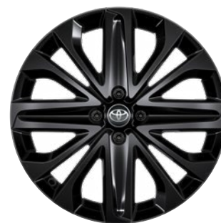
18" matt fekete könnyűfém keréktárcsák éjfeke betéttel, 175/60 R18 Alapfelszereltség: Style Design (2UP és 2VN karosszériaszín)