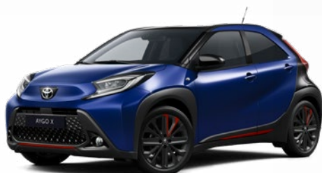
2VL Boróka kék fekete tetővel Felár nélkül Elérhető a Style Design felszereltségnél