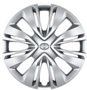
17" acél keréktárcsák díztárcsával, 175/65 R17 gumiabroncs Alapfelszereltség: Comfort