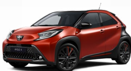
2VH Chilivörös fekete tetővel Felár nélkül Elérhető a Style Design felszereltségnél