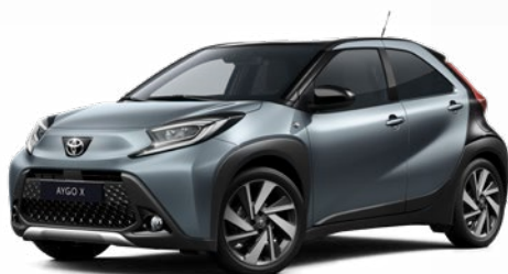
2UP Szürkéskék fekete tetővel Felár nélkül Elérhető a Style és Executive felszereltségnél