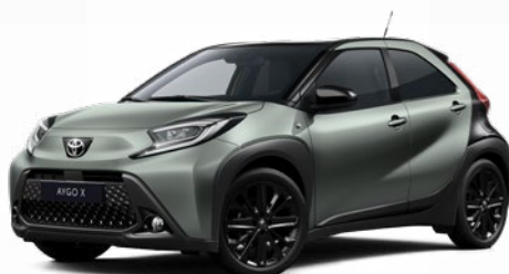
2VN Olivazöld fekete tetővel Felár nélkül Elérhető a Style Design felszereltségnél