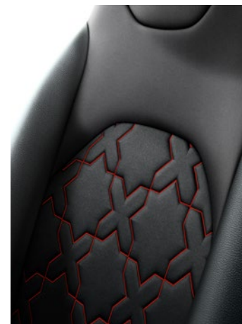
Szövet-bőr (szintetikus) ülésborítás Alapfelszereltség: Executive