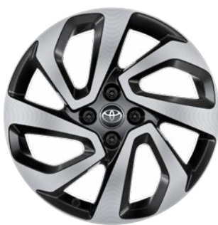
17" könnyűfém keréktárcsák, 175/65 R17 gumiabroncs Alapfelszereltség: Style