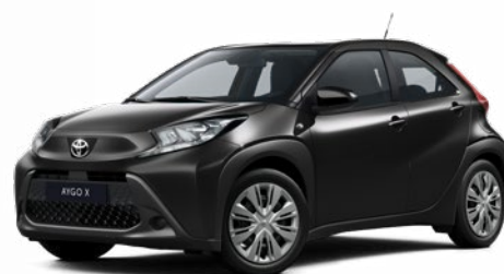
209 Éjfékete* 130 000 Ft Elérhető a Comfort felszereltségnél