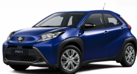
8Y8 Boróka kék* 130 000 Ft Elérhető a Comfort felszereltségnél