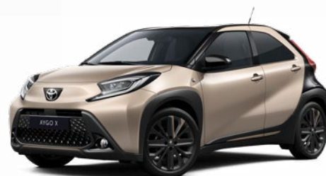
2VJ Gyömbér bézs fekete tetővel Felár nélkül Elérhető a Style Design felszereltségnél