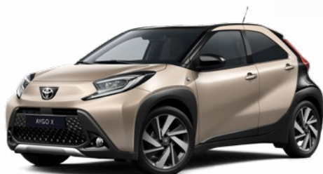
2VJ Gyömbér bézs fekete tetővel Felár nélkül Elérhető a Style és Executive felszereltségnél