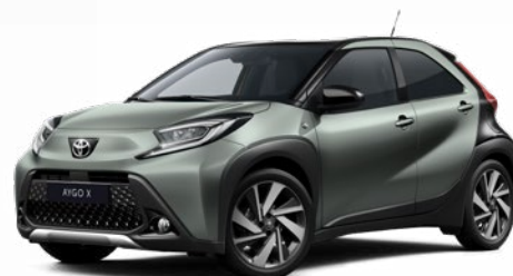
2VN Olivazöld fekete tetővel Felár nélkül Elérhető a Style és Executive felszereltségnél