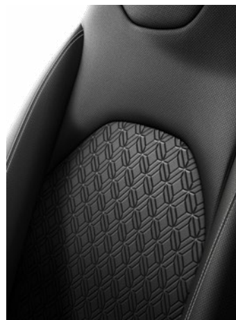
Fekete szövet ülésborítás, fehér varrással Alapfelszereltség: Style 2NR színben