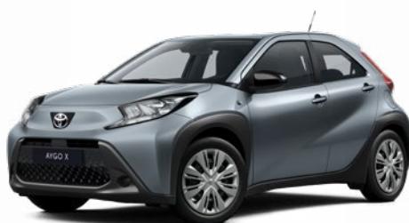
1K3 Szürkéskék* 130 000 Ft Elérhető a Comfort felszereltségnél