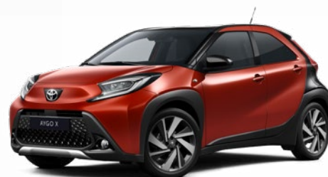
2VH Chilivörös fekete tetővel Felár nélkül Elérhető a Style és Executive felszereltségnél