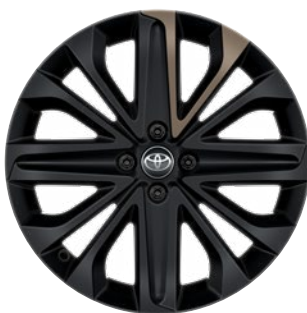
18" matt fekete könnyűfém keréktárcsák bézs betéttel, 175/60 R18 Alapfelszereltség: Style Design (2VJ és 2VK karosszériaszín)