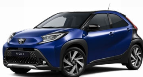
2VL Boróka kék fekete tetővel Felár nélkül Elérhető a Style és Executive felszereltségnél