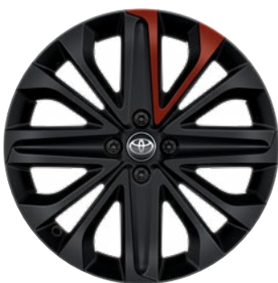
18" matt fekete könnyűfém keréktárcsák piros betéttel, 175/60 R18 Alapfelszereltség: Style Design (2VH és 2VL karosszériaszín)