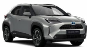
1L0 Palladium ezüst Metál Elérhető az Active, Comfort és Executive felszereltségeknél 145 000 Ft