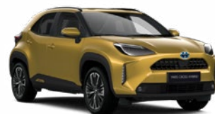
5C2 Aranymetál Metál Elérhető az Active, Comfort és Executive felszereltségeknél 145 000 Ft