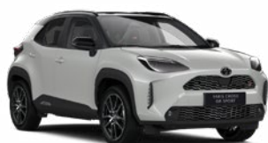
2RZ Higanyszürke fekete tetővel Metál Elérhető az GR SPORT felszereltségeknél Felár nélkül