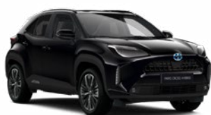
209 Éjfekete Metál Elérhető az Active, Comfort és Executive felszereltségeknél 145 000 Ft