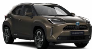
6X1 Barnászöld Metál Elérhető az Active, Comfort és Executive felszereltségeknél 145 000 Ft