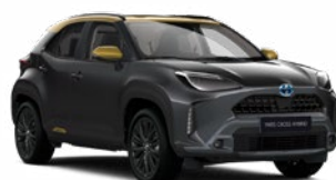
2UA Hamuszürke aranymetál tetővel Metál Elérhető az Adventure és Premiere Edition felszereltségeknél Felár nélkül