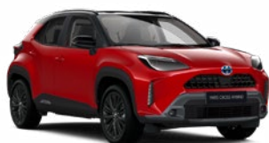
2SZ Érzéki vörös fekete tetővel Egyedi Elérhető az Executive, Adventure, GR SPORT és Premiere Edition felszereltségeknél Felár nélkül