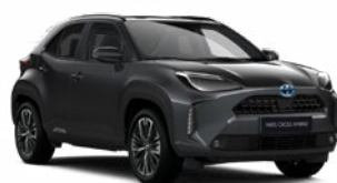
1G3 Hamuszürke Metál Elérhető az Active, Comfort és Executive felszereltségeknél 145 000 Ft