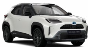
2PU Gyöngyházfehér fekete tetővel Gyöngyház Elérhető az Executive, Adventure, GR SPORT és Premiere Edition felszereltségeknél Felár nélkül