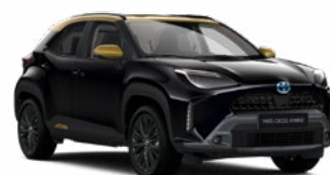
2UB Éjfekete aranymetál tetővel Metál Elérhető az Adventure és Premiere Edition felszereltségeknél Felár nélkül