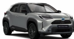
2VU Palladium ezüst fekete tetővel Metál Elérhető az Executive, Adventure, GR SPORT és Premiere Edition felszereltségeknél Felár nélkül