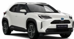
089 Gyöngyház Gyöngyház Elérhető az Active, Comfort és Executive felszereltségeknél 195 000 Ft