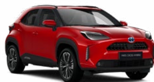
3U5 Érzéki vörös Egyedi Elérhető az Active, Comfort és Executive felszereltségeknél 195 000 Ft