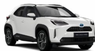
040 Hófehér Alapszín Elérhető az Active, Comfort és Executive felszereltségeknél Felár nélkül