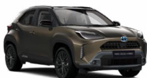
2TK Fekete barnászöld tetővel Metál Elérhető az Executive, Adventure és Premiere Edition felszereltségeknél Felár nélkül