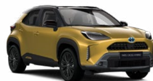
2VS Aranymetál fekete tetővel Metál Elérhető az Executive, Adventure és Premiere Edition felszereltségeknél Felár nélkül