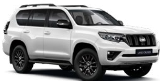
040 Hófehér felár nélkül