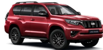
3R3 Barcelona vörös* 330 000 Ft