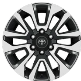
19" kéttónusú csiszolt hatású könnyűfém keréktárcsák Alapfelszereltség Comfort és Invincible felszereltségi szinteken