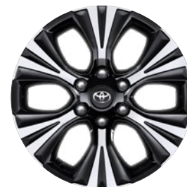
19" könnyűfém keréktárcsa Opcióként rendelhető a Comfort, Invincible és Executive modellekhez