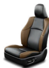
Fekete bőrülés barna betétekkel Alapfelszereltség az Executive felszereltségi szinten