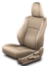
Bézs színű szövetkárpit Alapfelszereltség a Prado Family felszereltségi szinten