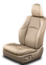
Bézs bőrkárpit (természetes / szintetikus bőr) Alapfelszereltség az Invincible felszereltségi szinten