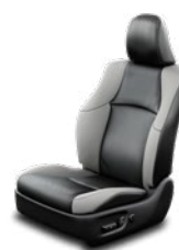
Fekete bőrülés szürke betétekkel Alapfelszereltség az Executive felszereltségi szinten