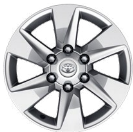
17" könnyűfém keréktárcsa Alapfelszereltség a Prado Family felszereltségi szinten