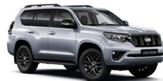
1F7 Ultraezüst* 330 000 Ft