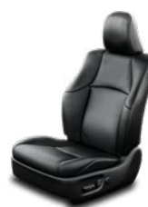
Fekete bőrkárpit (természetes / szintetikus bőr) Alapfelszereltség az Invincible felszereltségi szinten