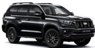
202 Fekete felár nélkül