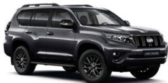
1G3 Hamuszürke* 330 000 Ft