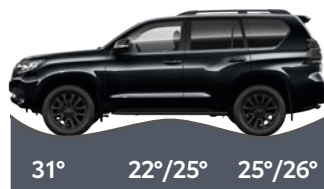
Első terepszög, rámpaszög, hátsó terepszög