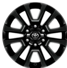
18" matt fekete könnyűfém keréktárcsák Alapfelszereltség az Executive felszereltségi szinten