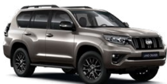
4V8 Avantgard bronz* 330 000 Ft