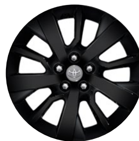
17" fekete könnyűfém keréktárcsák