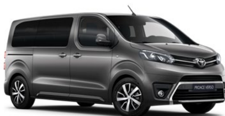
EVL Súlyomszürke Metálfényezés Bruttó 200 000 Ft