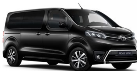
KTV Éjfekete Metálfényezés Bruttó 200 000 Ft