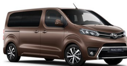
KCM Gesztenye barna Metálfényezés Bruttó 200 000 Ft

A karosszéria színe a felszereltségi szinttől is függhet.