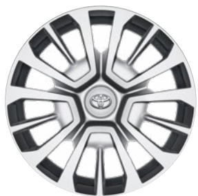
16" / 17" acél keréktárcsák dísz tárcsával