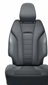
Szintetikus bőr és szövet ülésborítás Elérhető az Executive felszereltségnél