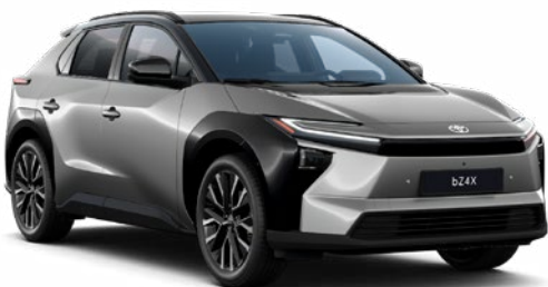
| TOYOTA BZ4X