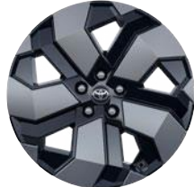
19" könnyűfém keréktárcsák 225/50 R19 gumiabronccsal Elérhető az Executive felszereltségnél