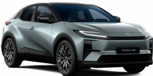
| TOYOTA C-HR+