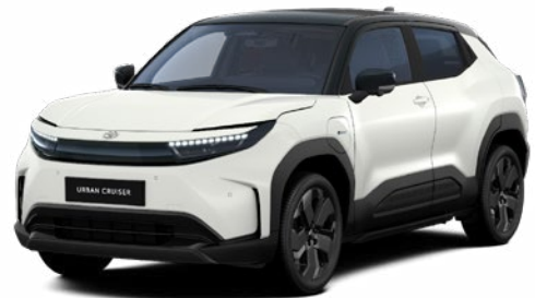
| URBAN CRUISER