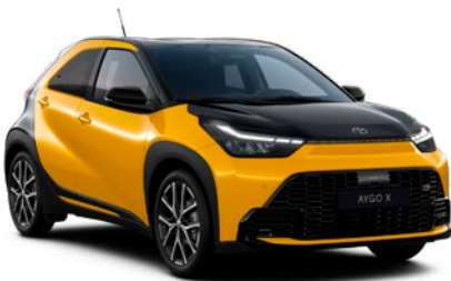
| AYGO X HYBRID