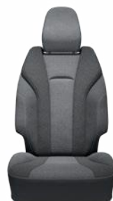
Fekete szövet ülésborítás Elérhető a Style felszereltségnél