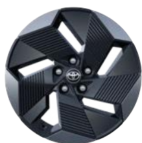
18" könnyűfém keréktárcsák, 225/55 R18 gumiabronccsal Elérhető a Style felszereltségnél