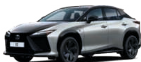
M53 PLATINA / GRAFIT FEKETE