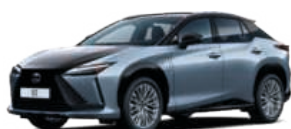
2YG ÉTER / GRAFIT FEKETE