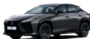
2YH ACÉLSZÜRKE / GRAFIT FEKETE