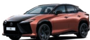
2YF ROZÉBARNA / GRAFIT FEKETE