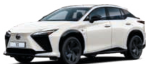
090 NEMES GYÖNGYHÁZFEHÉR