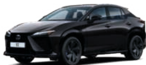
223 GRAFIT FEKETE