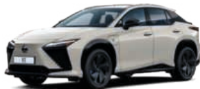
1N0 NEUTRINO SZÜRKE