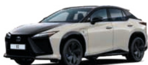
M48 NEUTRINO SZÜRKE / GRAFIT FEKETE